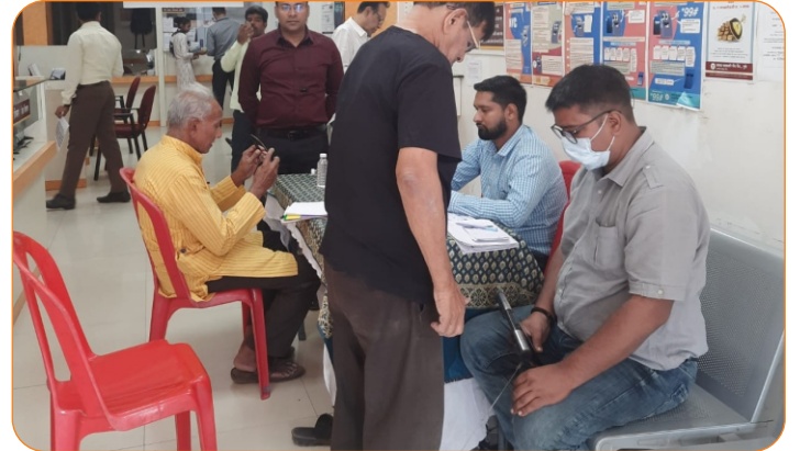
आरोग्य तपासणी शिबीरात सहभागी ग्राहक