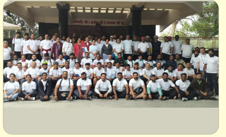
सायकल रॅलीत सहभागी असलेले सर्व सायकलपटू