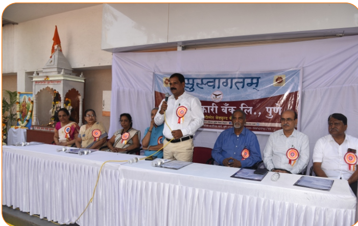
रक्तदान शिबीर उद्घाटन कार्यक्रमास उपस्थित मान्यवर

शिबिरात एकूण २७५ रक्त पिशव्यांचे संकलन झाले. शिबिरात महिला सेवक व खातेदार यांचादेखील सहभाग उल्लेखनीय होता.