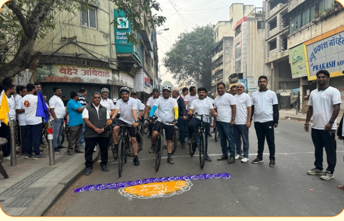
बाजीराव रोड शाखा येथे सायकल रॅलीस सुरुवात होत असताना